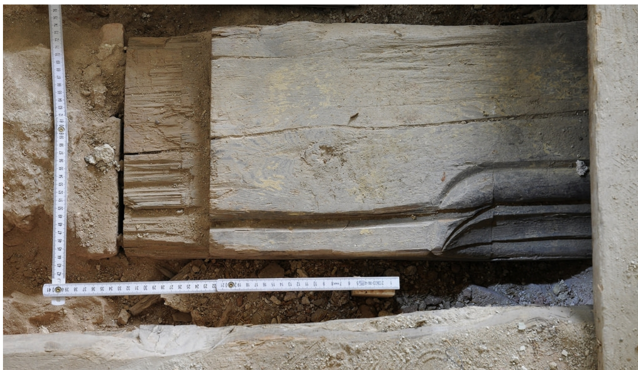
Severní zakončení trámu.